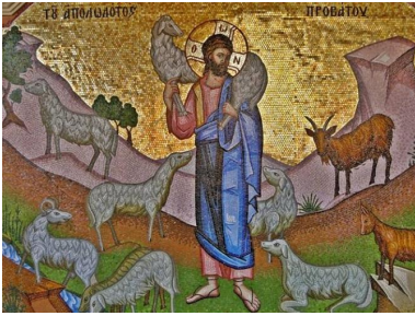
« La brebis perdue » Mosaïque XVIIIème siècle Monastère de Kykkos, Chypre