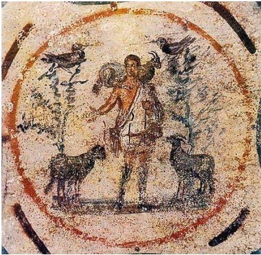
« Le Bon Pasteur » Fresque, 250-300 Catacombe de Priscille, Rome