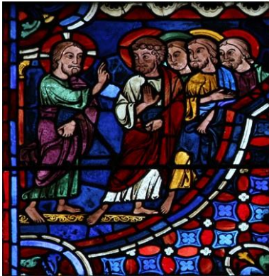
« Jésus enseigne » Verrière des apôtres (détail) 1210-1225 Chœur de la Cathédrale, Chartres