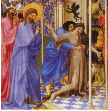
Très Riches Heures du Duc de Berry Manuscrit sur vélin Collectif, 1410-1440 Musée Condé, Chantilly