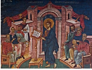
« Christ à la synagogue de Nazareth » Lieu et période inconnus