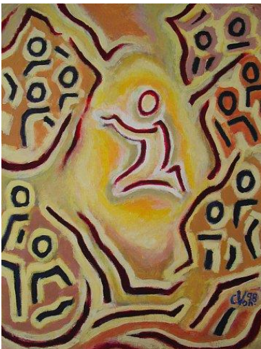
« La prière sacerdotale », Série « Couleur d'Évangile » (tableaux de commentaire de l'évangile de St Jean, 2011