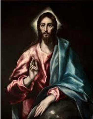
« Le Sauveur » Domínikos Theotokópoulos, dit Le Greco, 1595-1600 Galerie Nationale d'Ecosse, Edimbourg