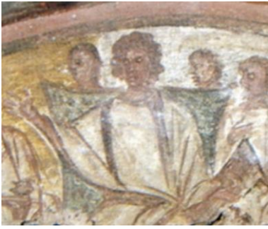
Plus ancienne représentation de la Cène, Catacombes de Domitille, Rome, IVème siècle